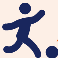
Huidig Schieten of passen